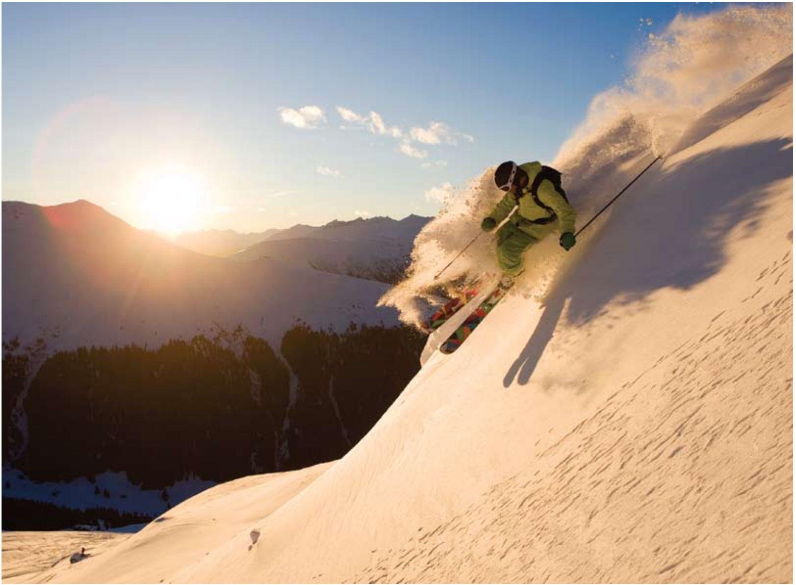
▲ Camparrangøren siger tak for solskin og superpudder.