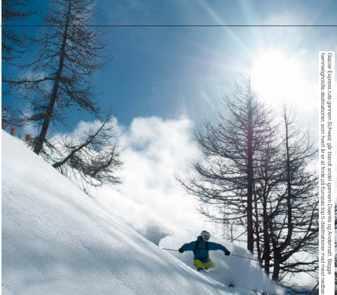
Glacier Express rute gennem Schweiz går blandt andet igennem Disentis og Andermatt. Bøge hjemmelignende destinationer, som hvert år er at finde på Europas top 10-destinationer med mest nedbør.

Afhængigheder har det med at gøre én irrationel og sløv, men i modsætning til